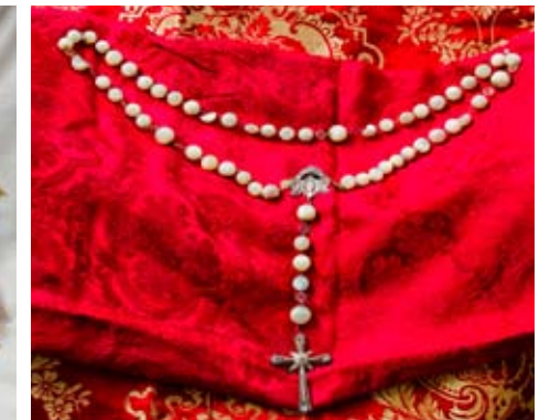
Rosario antiguo, en plata y cuentas de nácar

Mi agradecimiento Angel Rafael Cabrera Castro, autor de las fotografías y a Marta Matos Martínez, camarera de la Virgen del Rosario por mostrarnos el ajuar.