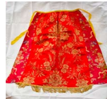
Saya bordada en Oro