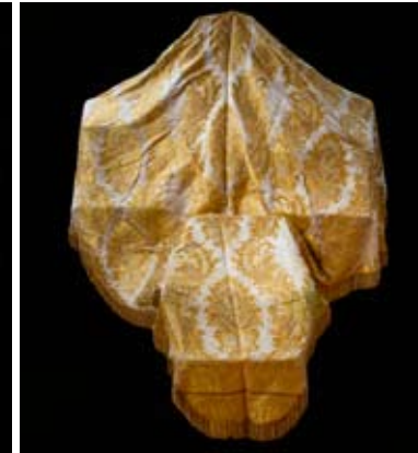
Mato bordado en dorado. El más antiguo de los cuatro mantos que actualmente tiene. Es anterior a la Guerra Civil.