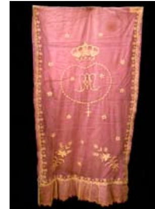
Este frontal, en tul de seda, es la prenda más antigua del ajuar de la Virgen.

He aquí algunas de las prendas y alhajas más antiguas del ajuar actual de nuestra Patrona la Virgen del Rosario: