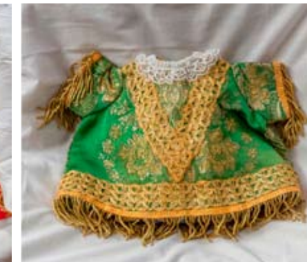
Vestido del Niño Jesús